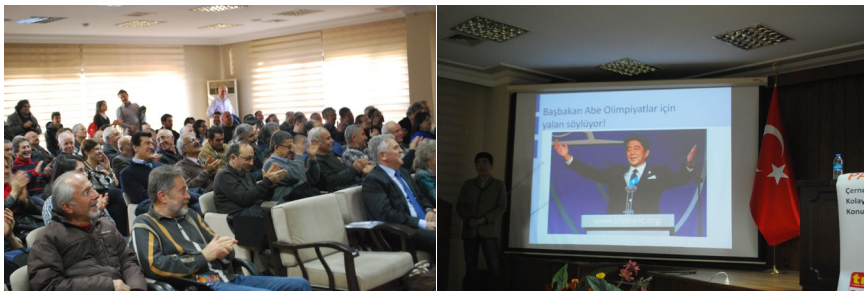
うちの国の首相を信用しないで下さいと発言するとやんやの喝采が

例えば三菱重工はコアキャッチャーをつけた原発を作ると言っています。原子炉格納容器内で、メルトダウンして落ちてきた核燃料をキャッチするので安全だと言うのです。仮にそれで良いとするなら、コアキャッチャーがない原発はダメだということになります。そうしたら、今動いている10基の原発はもちろん、日本にコアキャッチャーのついている原発など一つもないのだ