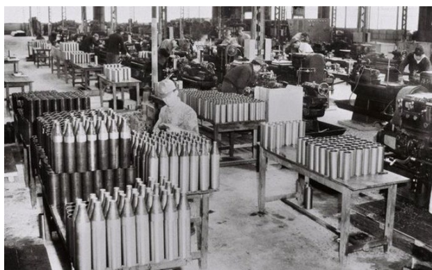
米軍の砲弾を作る日本の工場 朝日新聞デジタル版

今の経済政策は新自由主義と言います。その軸にあるのが緊縮財政なのですが、それを終わりにして、バラキ財政に転換しようとしているのです。バラキ財政はケインズ主義といいますが、その対象によって大きく意味が違ってきます。では岸田政権や経団連がどこにバラ撒こうとしているのかというと、とにかく「脱炭素化」と言えば、何でもお金が出るようにしようとしています。エネルギー部門、技術部門に潤沢に資金を回そうとしているのです。その基軸の一つに位置付けられているのが原発です。さらにGX会議の項目には入れてないのですが、実はバラキの対象として大きく狙われているのが軍拡です。