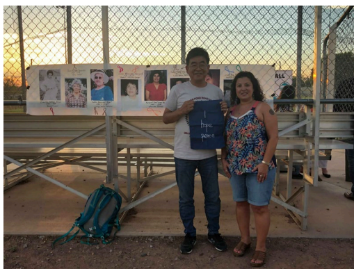
核実験で犠牲になった家族の写真を掲げた 女性とともに アラゴモードにて